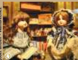
Musée de la poupée et du jouet ancien - Wambrechies.

Robersart abritent l'Isle aux Jouets, un musée des jouets, entretenus par des passionnés de voitures de collection version mini, de poupées de porcelaine et autres petits soldats. Ces jouets anciens, mis en scène brillamment, nous replongent aux temps de l'insouciance parfumée aux caramels et à la barbe à papa. Sur les traces des objets anciens, se tiennent les membres de l'association Amitram. Ils sont quelques