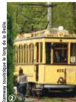
Tramway touristique le long de la Deûle.