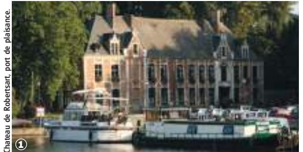
Château de Robersart, port de plaisance.

(3,5 ou 12 km - 1 h 10 ou 3 h 00 à 4 h 00)