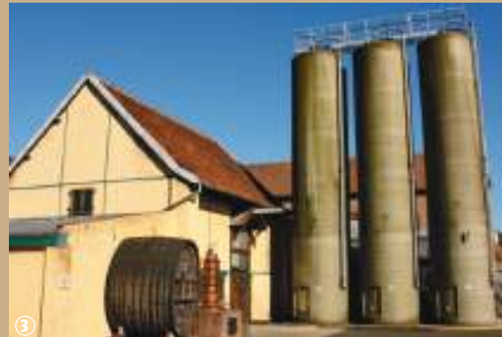
Distillerie Claeysens à Wambrechies

uns à restaurer des anciens tramways (« trams ») et Mongy de Lille-Roubaix-Tourcoing, vieux de presque un siècle, ainsi que quelques bus rétros. Comble de la passion, un tramway touristique de 1906, avec ses banquettes en bois, relie à la belle saison, Wambrechies à Marquette, en longeant